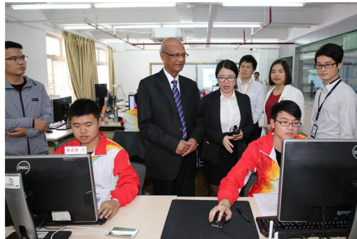
孟加拉国教育部部长努尔·伊斯兰·纳希德先生观摩我院选手训练

虽然我们冲击阿布扎比没有成功，但是，我们的教练和选手从国家队技术专家和教练身上学到了很多训练思路和方法，积累一些宝贵经验，找到了差距与不足，向全国兄弟院校和国家队技术专家展示了劳职院师生努力拼搏、积极向上的良好精神面貌。我们将以全新的面貌，从零开始、精心准备，为下一届大赛取得好成绩努力拼搏！